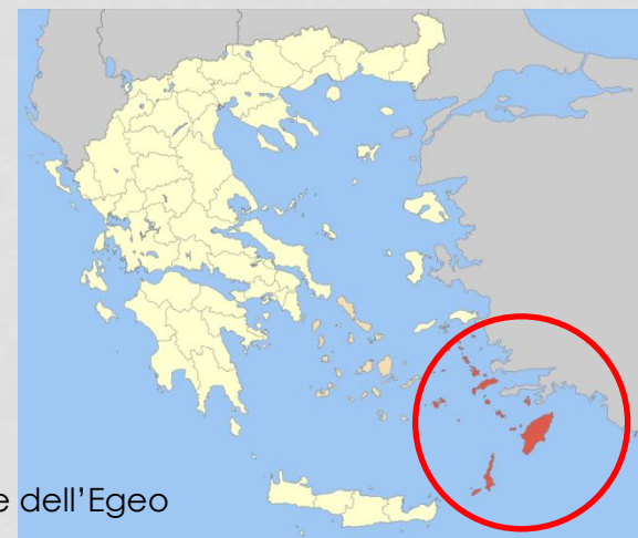
Le colonie italiane dell'Egeo