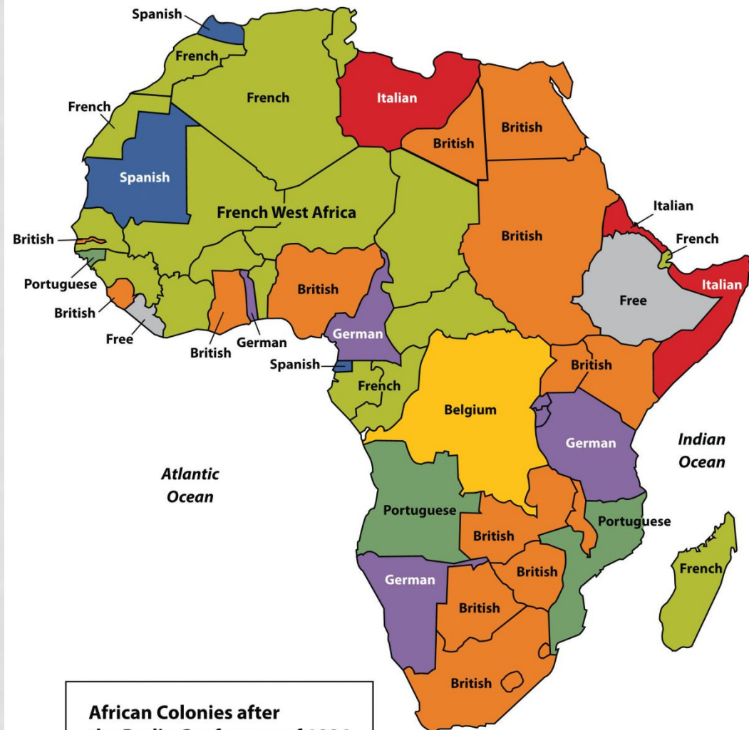
African Colonies after the Berlin Conference of 1884