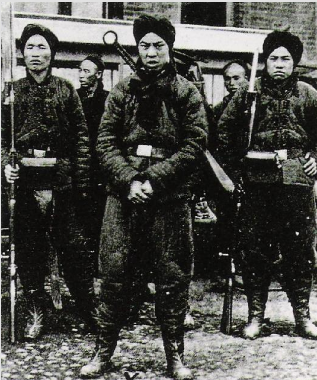
Un gruppo di Boxer