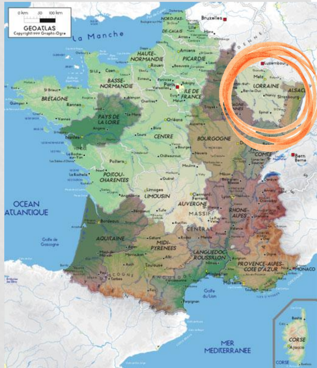
Le regioni dell'Alsazia e della Lorena