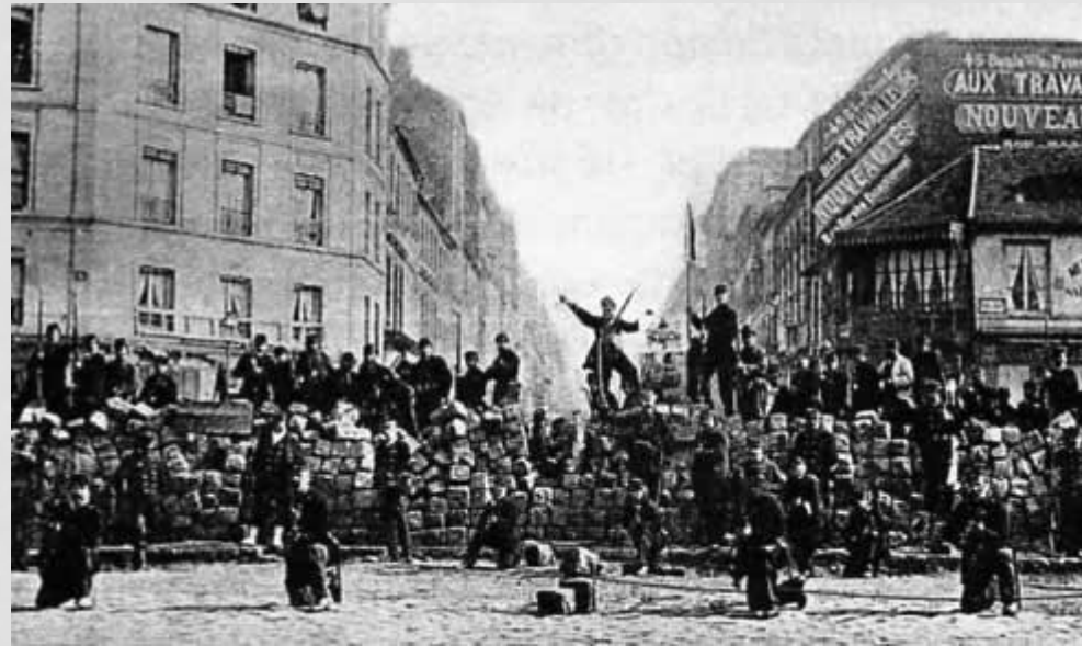
Comunardi erigono barricate a Parigi