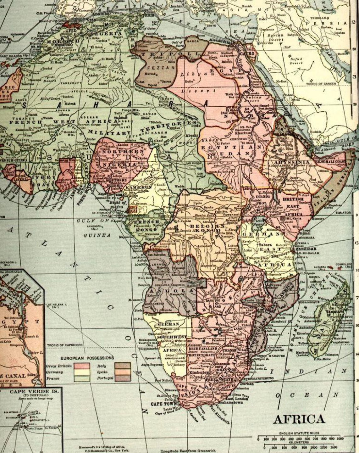
Le colonie francesi in Africa nel 1910 (in verde)