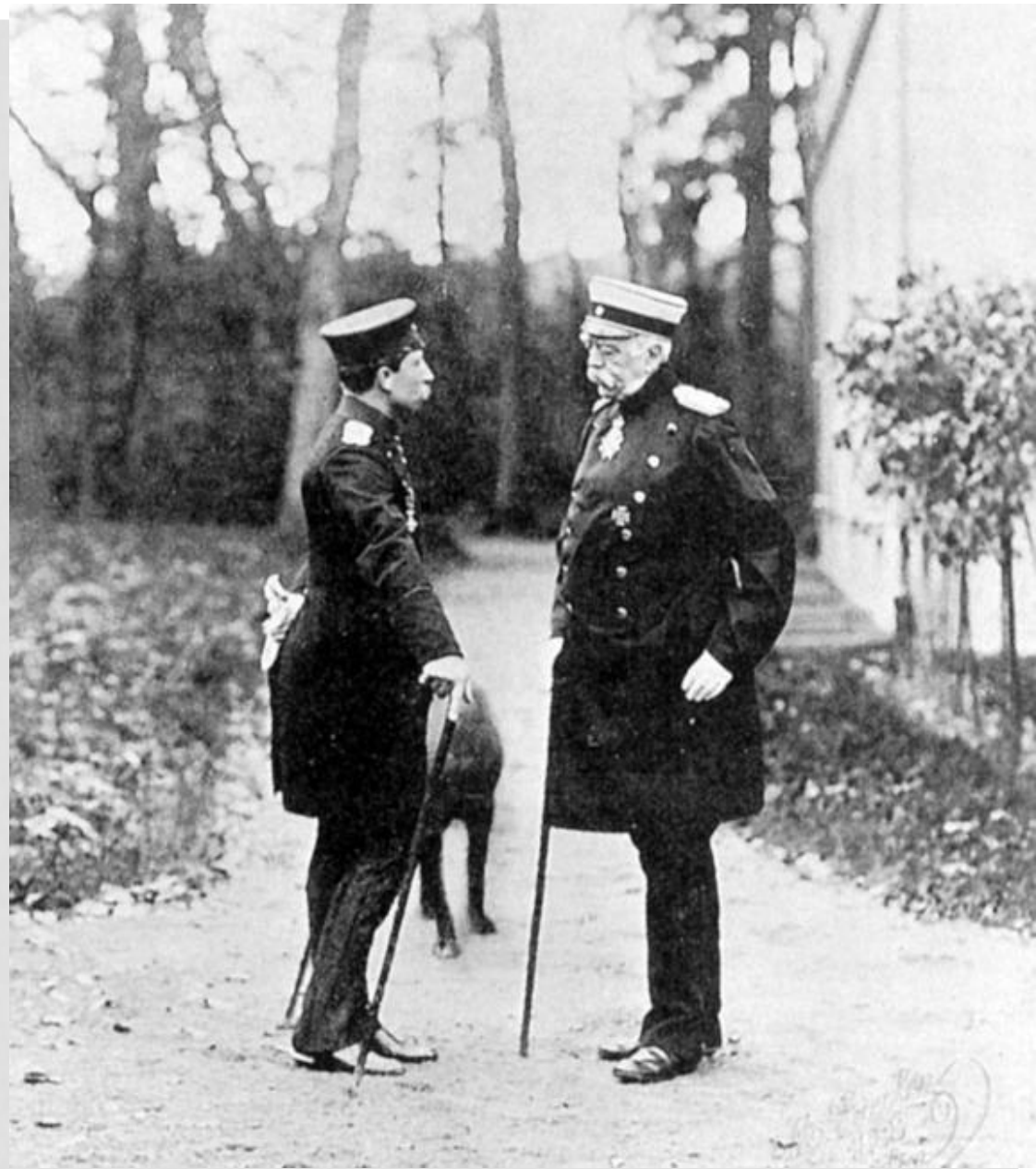
L'imperatore Guglielmo II e Bismarck a Friedrichsruh il 30 ottobre 1888.